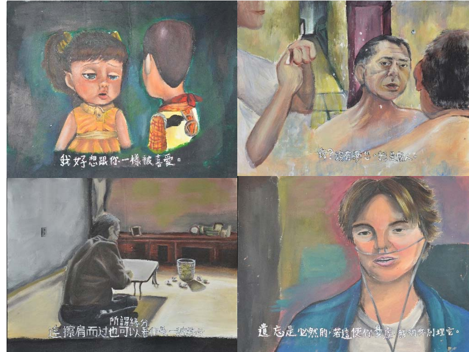
作品 3 孤獨與寂寞 塑膠彩布本 48 x 29 厘米 (4幅)